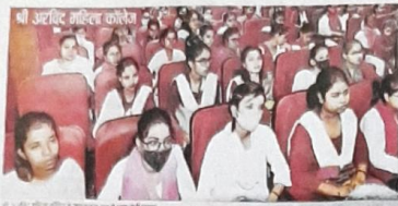
श्री अरविंद महिला कॉलेज