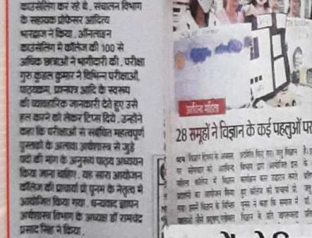
28 सप्ताहों में विज्ञान के कई पहलुओं पर बनाए माँट