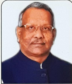
श्री तारकिशोर प्रसाद माननीय उपमुख्यमंत्री, बिहार

* The concepts to enlighten citizens to the world will be background of all our endeavours.