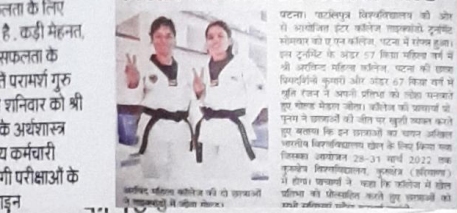
श्री अरविंद महिला कॉलेज की छात्राओं ने जीता गोल्ड

पटना। राष्ट्रीय स्तर पर आयोजित की गई थी अरविंद महिला कॉलेज में 100 से ज्यादा छात्राओं की हुई ऑनलाइन काउंसिलिंग