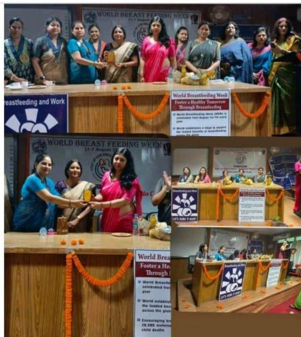
Celebration of World Breastfeeding Week (01-07 August 2022)