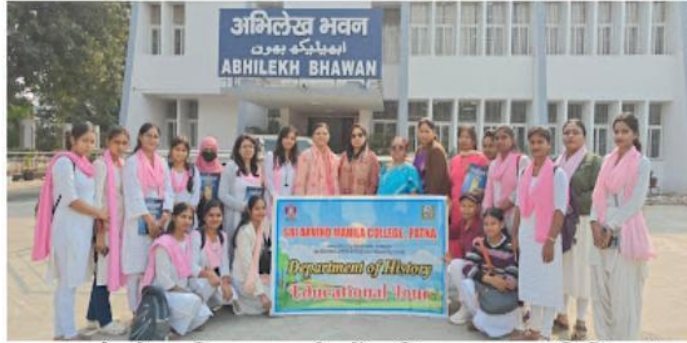
भ्रमण के दौरान लिए गए तस्वीर में शामिल छात्राएं एवं शिक्षिकाएं।

जोश भारत, संवाददाता | पटना। श्री अरविंद महिला कॉलेज, पटना, इतिहास विभाग द्वारा पी.जी. सेमेस्टर 1 के छात्राओं का बिहार आर्काइव्स में शैक्षणिक शैक्षिक भ्रमण महाविद्यालय के इतिहास विभाग द्वारा आज दिनांक 21 नवंबर 2025 को