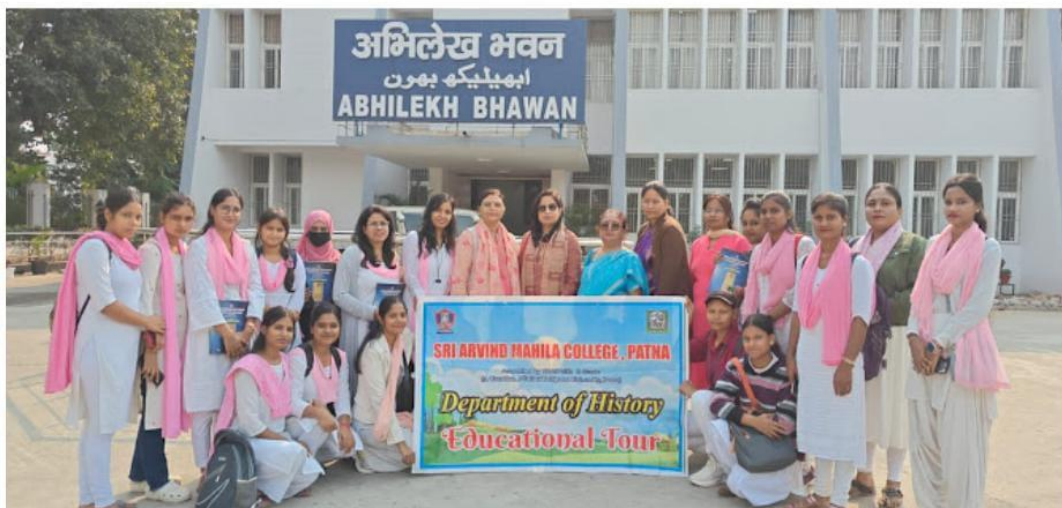
भ्रमण के दौरान लिए गए तस्वीर में शामिल छात्राएं एवं शिक्षिकाएं