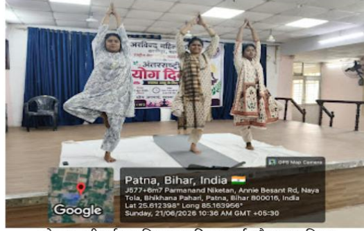
योगा करती हुई महाविद्यालय की प्राचार्या और प्राध्यापिका