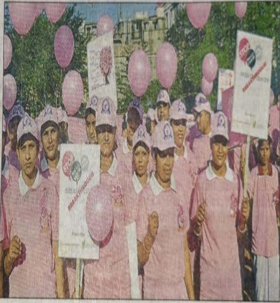
Volunteers and schoolchildren take part in 'Pink Walk' to create awareness against breast cancer in Patna on Sunday